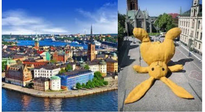
写真はイメージです。